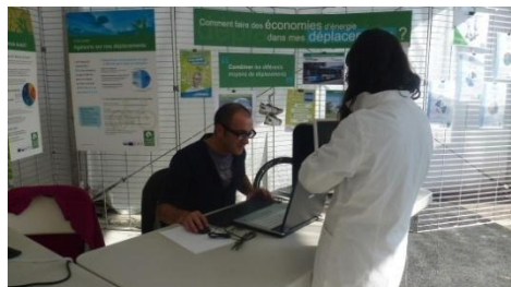
Journée d'animation pour la mobilité chez Siemens

Action : accompagnement semi-collectif des employeurs du territoire pour les aider à mettre en place des actions favorisant l'écomobilité de leurs salariés (outils, méthodologie et cadre d'échanges).